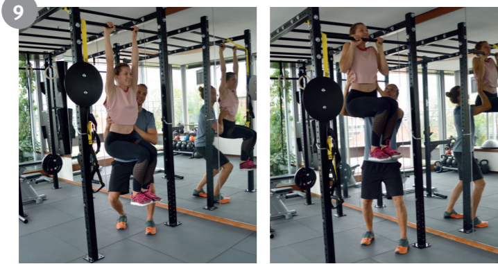
9 Klimmzug mit Unterstützung Pull up with help