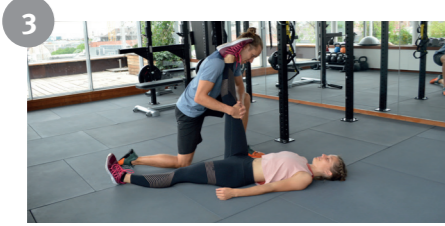
3 Dehnung Hamstrings Stretch Hamstrings