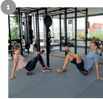
1 Hartschaumrolle Gesäß Foam Roll Glutes