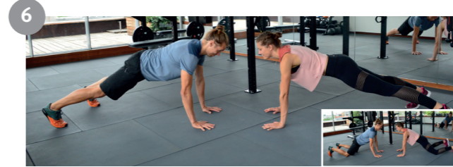
6 Liegestütz (alternativ Knie Liegestütz) mit Abklatschen beidhändig Push-ups (alternatively knee push-ups) with high-five with both hands