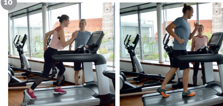
10 Laufband Treadmill